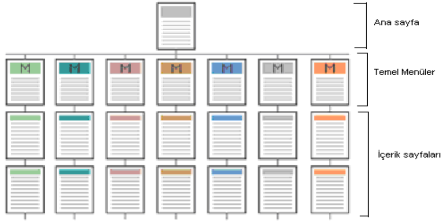
Şekil 1 Bilgi Yapılandırması

Site içinde sunulan bilgiler mantıksal anlamda tutarlı olacak şekilde organize edilmeli ve önem düzeyi de dikkate alınarak yapılandırılmalıdır. Şekil 1 'de örnek bir bilgi yapılandırılması verilmiştir. Bu yapı düzenli olup, her dokümanın kolay bulunabilmesini ve kolay geri dönüş imkanı sağlamaktadır.