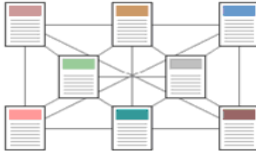
Şekil 5 Ağ Yapısı

Bu yapı getirdiği erişim kolaylığının yanında, karmaşıklığı artırmakta ve bakımı zorlaştırmaktadır.