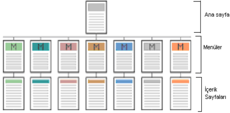
Şekil 6 Hiyerarşik Yapı

Aşağıdaki grafik bu dört tip yapılandırmanın çeşitli kriterler açısından karşılaştırmasını yapmaktadır. Grafikte yatay eksende ilerledikçe anlaşılma zorluğu artmakta buna karşın esneklik kazanılmaktadır. Dikey eksende ilerlemek ise karmaşıklığı artırmakta, kullanıcı bilgi düzeyinin artmasını gerektirmektedir.