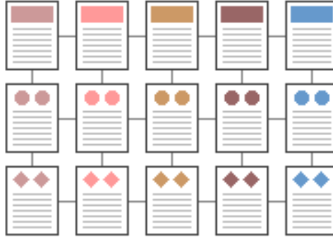
Şekil 4 Izgara Yapısı

Kullanılan bilgi organizasyonu türlerinden biri de Izgara Yapısı'dır. Bu yapıda dokümanlar arası bağlantılar bir ızgara yapısı şeklinde kurulur. Bağlantılar Bilgi Dizisi'nde olduğu gibi tek boyutlu olmayıp, her doküman tüm komşularına bağlantı içerir. Bu tür bir yapının kurulması, bazı kullanıcılar için anlama ve kullanma zorluğu yaratabilir.