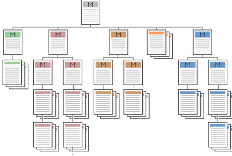
Şekil 10 Dengeli Menü Yapısı

Kamu kurumları internet sitelerinde site içi dolaşım sistemlerinin dengeli yapıda olmasına gayret gösterilmelidir. Kamu internet sitelerinde yer alan tüm sayfalar en az bir başka sayfaya bağlantı içermelidir. Her sayfa hiyerarşik yapıda bir üstünde olan sayfaya ya da ana sayfaya bağlanabilmelidir. Başka hiçbir sayfaya bağlantı içermeyen sayfalar “Çıkmaz Sokak” (Dead-End) olarak adlandırılır ve kullanıcı bu sayfalardan ancak tarayıcının sağladığı geri dönüş imkanıyla ayrılabilir. Kamu internet siteleri Çıkmaz Sokak içermemelidir.